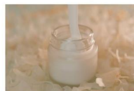
POLYNAT® T11, alternative aux polymères synthétiques