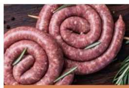
Stabilisants pour Produits Carnés et Alternatives