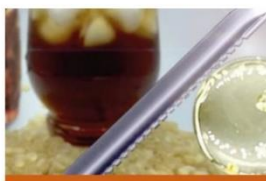
Ester Glycérique de Colophane de Bois-E445