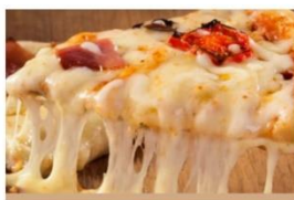
Stabilisants et Texturants pour Fromages Analogues